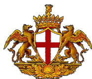
Comune di Genova