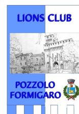
Lions Club Pozzolo Formigaro

MOTO CLUB GENOVA LIONS CLUB GENOVA SAN LORENZO LIONS CLUB POZZOLO FORMIGARO organizzano